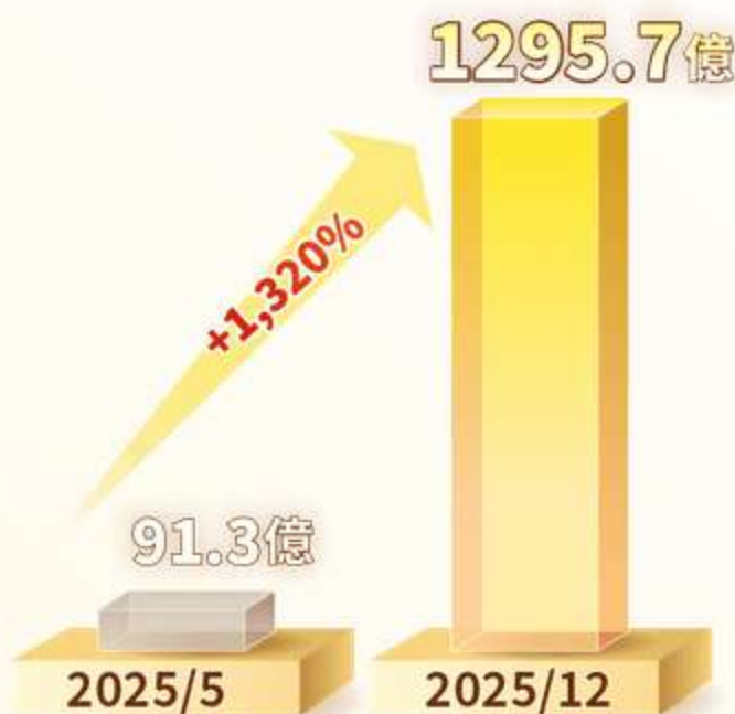
台股主動ETF增長快速 2025年規模成長 逾13倍

上述內容提及之歷史數據，不代表本基金之走勢及績效，本基金投資風險請詳閱基金公開說明書。 資料來源：投信投顧公會、CMoney，統一投信整理，首檔台股主動式ETF於2025/5掛牌，資料截至2025/12，以上皆為各月份月底數據。