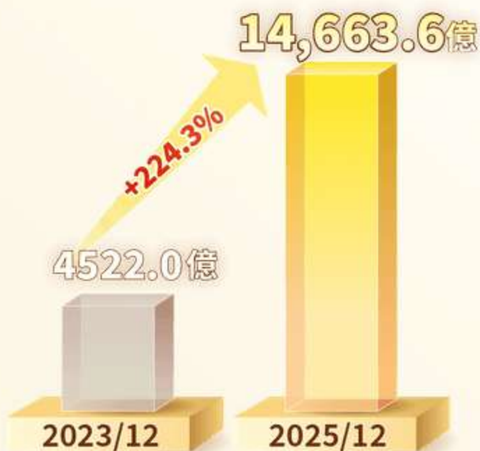
台股市值型ETF規模巨大 近2年快速增加至 1.46兆

台股市值型ETF具規模優勢、主動式ETF則成長迅速 統一投信結合 市值穩健 × 主動洞察 優勢 開啟台股ETF投資新篇章