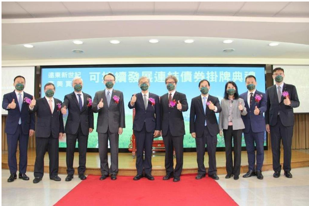
圖：首檔可持續發展連結債券 ( SLB ) 上櫃掛牌典禮2022年9月14日舉辦。

遠東新世紀股份有限公司於2022年9月14日櫃買中心掛牌首檔可持續發展連結債券 ( SLB )，本檔可持續發展連結債券由元大證券擔任主辦承銷商，發行期間5年，金額共25億元。以呼應遠東新永續策略藍圖重大主題，將產銷活動連結永續發展目標 ( SDGs )，選定「溫室氣體排放減量」及「綠色產品營收成長」作為可持續發展關鍵指標 ( KPIs ) 及績效目標 ( SPTs )，宣揚公司支持永續發展的理念與決心。